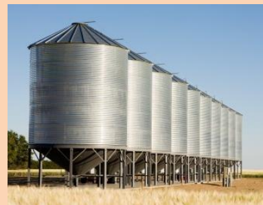
Наличие 1 зернотока (зернохранилища)