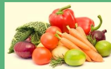
Валовый сбор овощей – 657тонн