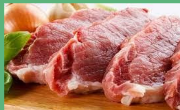
Производство мяса скота – 798,5тонн

Техническое перевооружение сельскохозяйственных организаций за 2023 год – 6 349 тыс. руб.