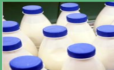
Производство молока – 3,84тыс. тонны