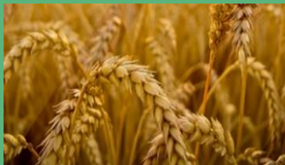
Валовый сбор зерна – 0,6тыс. тонн