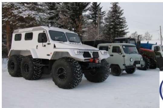
САУ «Тевризский лесхоз»

САУ Омской области «Тевризский лесхоз». Годовая заготовка древесины 17 - 20 тыс. куб.м.