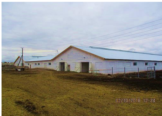
ООО «Север - Агро»

Семейная животноводческая ферма Общее поголовье КРС составляет 119 голов, в том числе 52 коровы Перспективы развития: увеличение поголовья животных и посевных площадей