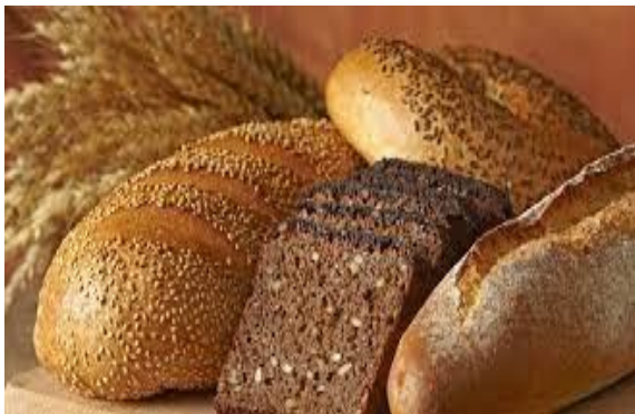
ПО «Хлебокомбинат Тевризский»

ПО «Хлебокомбинат Тевризский». Годовой выпуск хлеба, хлебобулочных и кондитерских изделий составляет 468 тонн