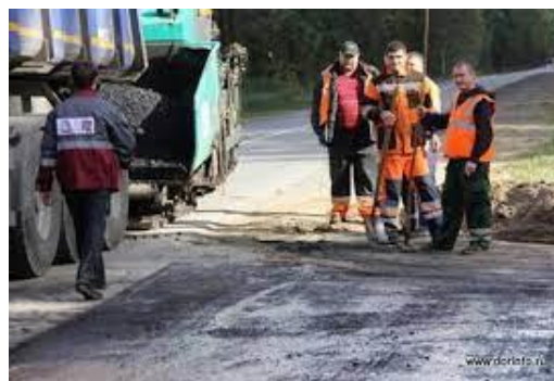
ГП «Тевризское ДРСУ»

САУ Омской области «Тевризский лесхоз». Годовая заготовка древесины 17 - 20 тыс. куб.м.