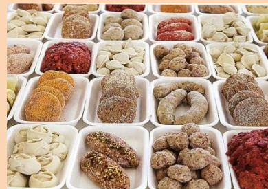
Производство мясных полуфабрикатов – 15,6 тонн