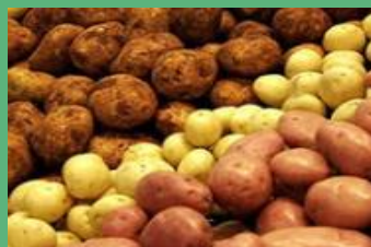
Валовый сбор картофеля – 4,5тыс. тонны