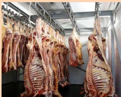
Наличие 1 убойного цеха