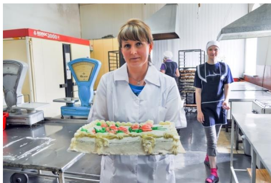
ИП «Горбачева Е.А.»

ПО «Хлебокомбинат Тевризский». Годовой выпуск хлеба, хлебобулочных и кондитерских изделий составляет 468 тонн