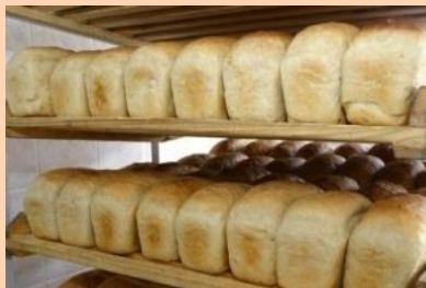
Производство хлеба, хлебобулочных и кондитерских изделий – 0,88 тыс. тонн